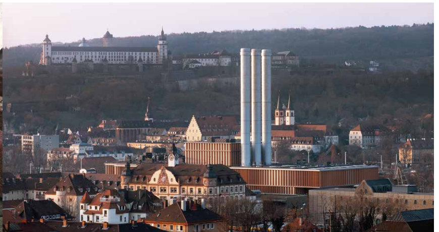
HKW Würzburg – begutachtet durch Müller-BBM