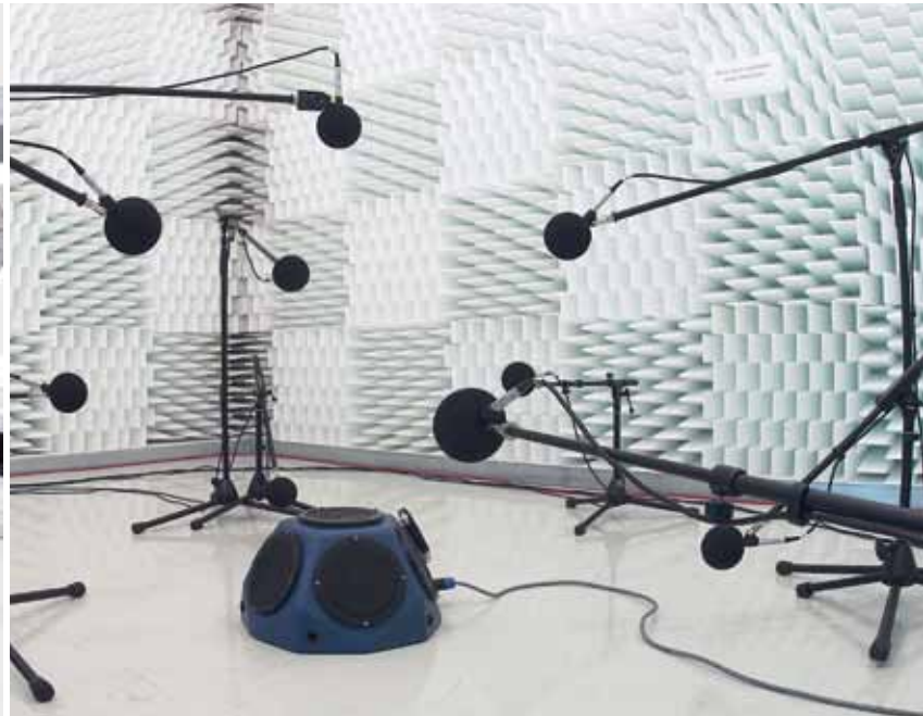
Messung im grundgeräusch- und reflexionsarmen Halbraum