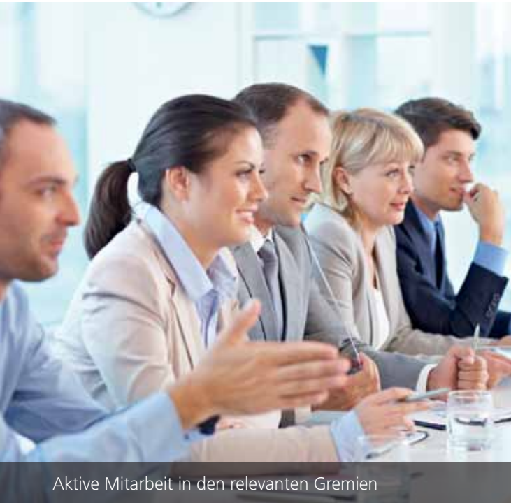
Aktive Mitarbeit in den relevanten Gremien

Die Experten von Müller-BBM mit ihrer langjährigen Erfahrung vermitteln Ingenieuren, Technikern sowie Arbeitsschutz- und Sicherheitsbeauftragten alles, was sie über Akustik, Industrieakustik und Schallschutz wissen müssen, um wettbewerbsfähige Angebote zu erstellen und Industrieanlagen sicher und gesetzeskonform zu betreiben.