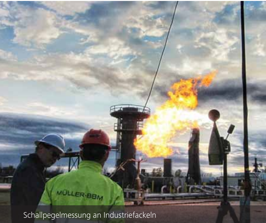
Schallpegelmessung an Industriefackeln

Müller-BBM ist seit 1962 auf dem Gebiet des industriellen Schall- und Schwingungsschutzes tätig. Im Vordergrund steht dabei immer ein interdisziplinärer Ansatz. Mit spezifischem Fachwissen und umfassendem Erfahrungshintergrund sind die Ingenieure von Müller-BBM nicht nur mit Betriebsabläufen, sondern auch mit verfahrenstechnischen Prozessen vertraut. Wir finden daher in enger Zusammenarbeit mit dem Anlagenbetreiber wirtschaftlich sinnvolle und praxistaugliche Lösungen.