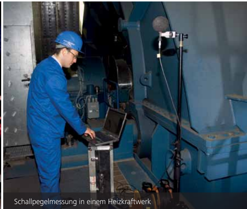
Schallpegelmessung in einem Heizkraftwerk

In den unterschiedlichen Stadien der Planung (Machbarkeitsstudie, Grundlagen- und Detailplanung) erstellen wir für Sie verlässliche Prognosen für die von Maschinen, Geräten, Gebäuden und Anlagenteilen ausgehenden Schallemissionen und deren Auswirkungen auf die Umgebung. Auf dieser Grundlage und unter Berücksichtigung der zulässigen Schallemissions- und -immissionsgrenzwerte schnüren wir Maßnahmenpakete für Schall- und Schwingungsschutz.