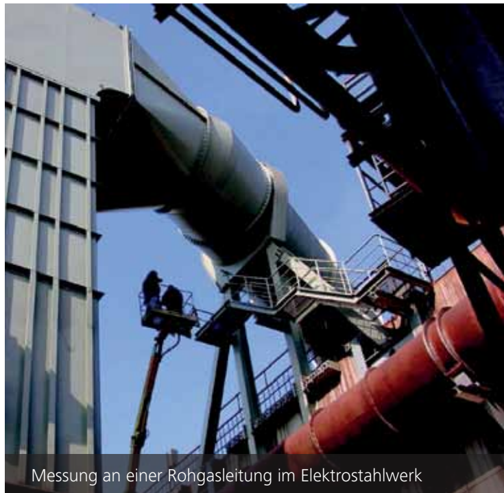
Messung an einer Rohgasleitung im Elektrostahlwerk

Müller-MBBM erarbeitet, spezifiziert und koordiniert alle erforderlichen Maßnahmen zur akustischen Optimierung für den effizienten, sicheren und umweltverträglichen Betrieb von Industrieanlagen und Arbeitsplätzen. Die gesetzlichen Anforderungen an Planung, Genehmigung, Errichtung, Abnahme und Betrieb technischer Anlagen haben wir dabei immer mit im Blick.