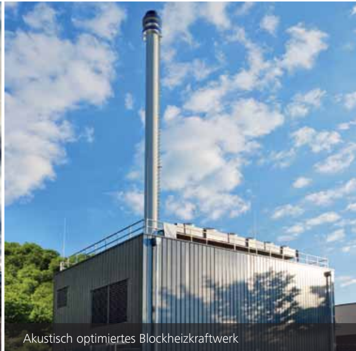
Akustisch optimiertes Blockheizkraftwerk

Ein stimmiges Gesamtkonzept beim Schall- und Schwingungsschutz bietet erfahrungsgemäß vielfältige Vorteile für Investoren und Betreiber von Industrieanlagen: